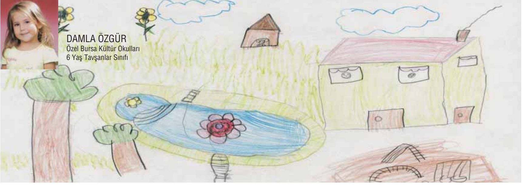
DAMLA ÖZGÜR Özel Bursa Kültür Okulları 6 Yaş Tavşanlar Sınıfı